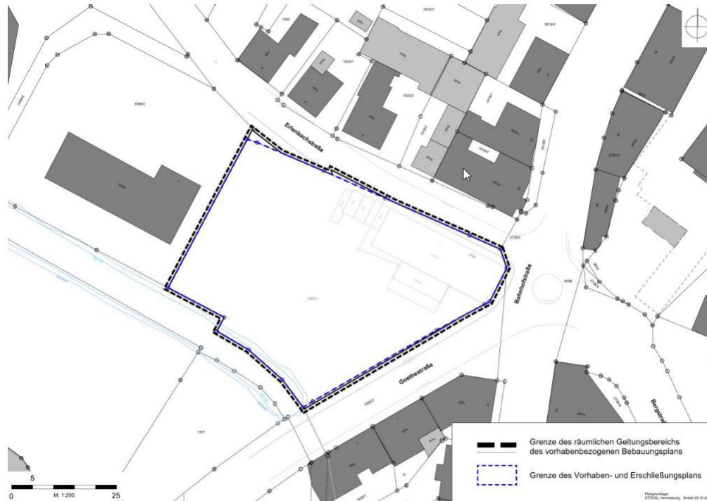
Abbildung 1: Grenze des räumlichen Geltungsbereichs des vorhabenbezogenen Bebauungsplans (schwarz); Grenze des Vorhaben- und Erschließungsplans (blau), ARP Stuttgart, 03.02.2026.

B2, Erlenbachstraße) sowie Teilflächen des Straßen-Grundstücks mit der Flst.-Nr. 1598/3 (B3, Goethestraße) einbezogen. Der Geltungsbereich des vorhabenbezogenen Bebauungsplans weist eine Fläche von ca. 2.825 m 2 auf und ist in der Planzeichnung des vorhabenbezogenen Bebauungsplans vom 03.02.2026 mit einem schwarzen, unterbrochenen Band umgrenzt.